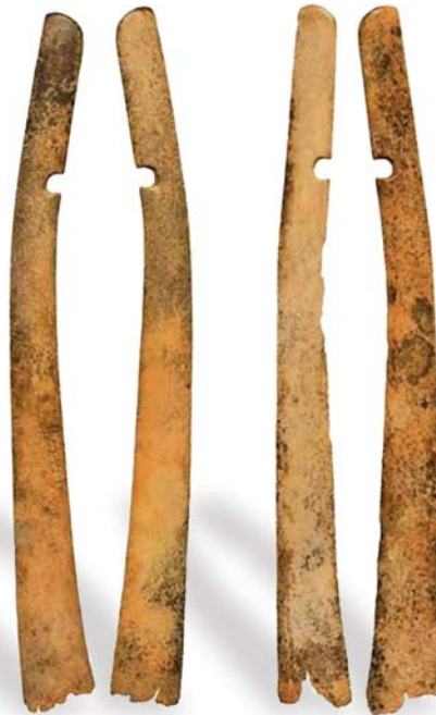
3. ábra: Magyarhomorog-Könyadomb 23. sír íjlemezei

A fentiek figyelembevételével már több - az alábbi kritériumoknak megfelelő - íjrekonstrukció készült, melyek a kísérleteknek köszönhetően bizonyították a Magyar Íj működőképességét, használhatóságát és hatékonyságát.