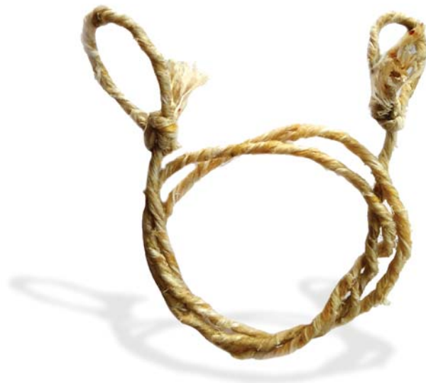
17. ábra: Sodort ínideg anyagában hurkolt füllel