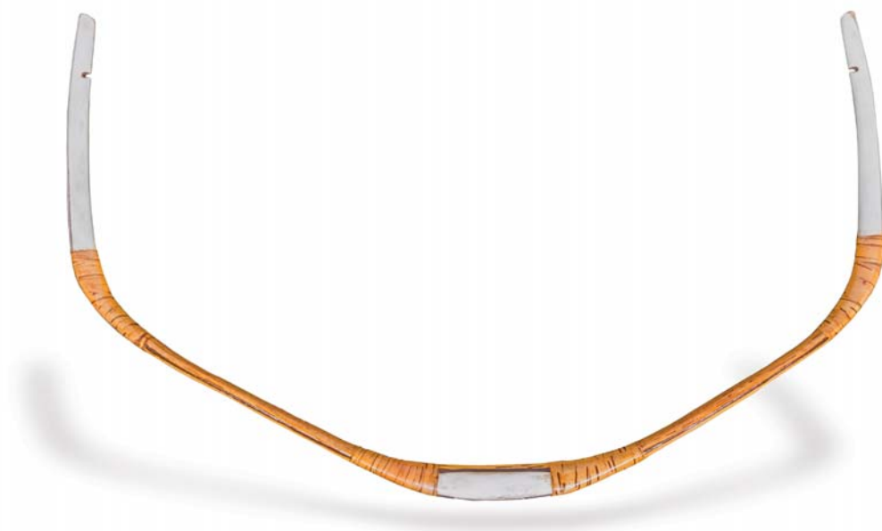
1. ábra: Magyarhomorog-Kónyadomb 103. sír íjrekonstrukció „B” változata, ajzatlanul

Az eurázsiai sztyeppéken élt népek összetett reflexíj-családjába tartozó IX-XI. századi Magyar Íj jól megkülönböztethető az „íjcsalád” többi tagjától. A Kárpát-medence területén eddig feltárt IX-XI. századi sírokból közel 300 sír tartalmazott íjmaradványokat (szarvasagancsból faragott szarv- és markolatlemezeket), mely jelentős mennyiségnek számít egész Euráziában. A IX-XI. századi leletanyag ezáltal világviszonylatban is egyedülálló lehetőséget biztosít a Magyar Íj egyedi jellemzőinek meghatározására.