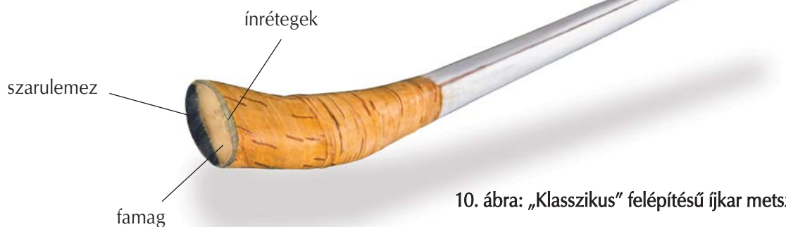
10. ábra: „Klasszikus” felépítésű íjkar metszete

A magyar íj karjainak felépítése összetett, vagyis az ún. klasszikus ázsiai íjakhoz hasonlóan fából, ínrétegekből és szarulemezéből áll.