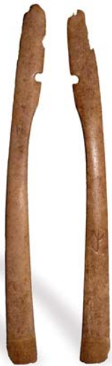
7. ábra: Békés Povádzug 45.

A szarvlemezek kialakítása során törekedni kell a jellegzetes formák alkalmazására: „fejes” (7. ábra), „fejetlen-törtvégtű” (8. ábra) és „fejetlen” (9. ábra).