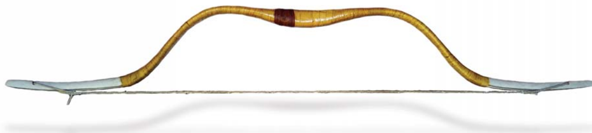
18. ábra: Magyarhomorog-Könyadomb 103. sír íjrekonstrukció „A” változata, ínideggel felajzva

Azon íjrekonstrukció nevezhető Magyar Íjnak, mely a fenti paramétereknek megfelel.