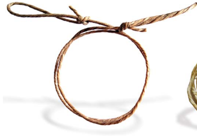
15. ábra: Sodort nyersbőrideg

A Magyar Íj idege természetes - jellemzően állati eredetű - anyagból (ín, bőr, bél stb...) vagy azok kombinációjából állt. Ezért a mai Magyar Íjnak rendelkeznie kell természetes anyagból készített lő-képes ideggel.