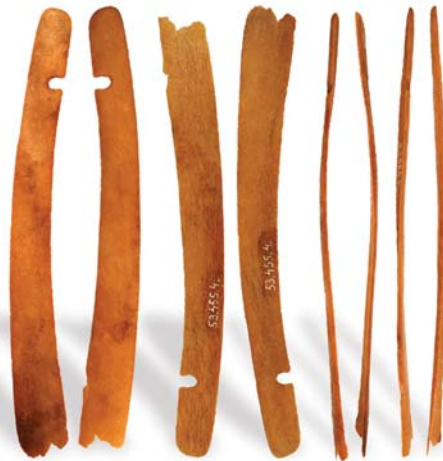
9. ábra: Szeged-Öthalompusztá 4.