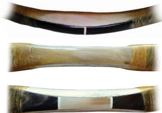
14. ábra: Markolatillesztések (fentről): markolatcsapos, -lapos és -léces