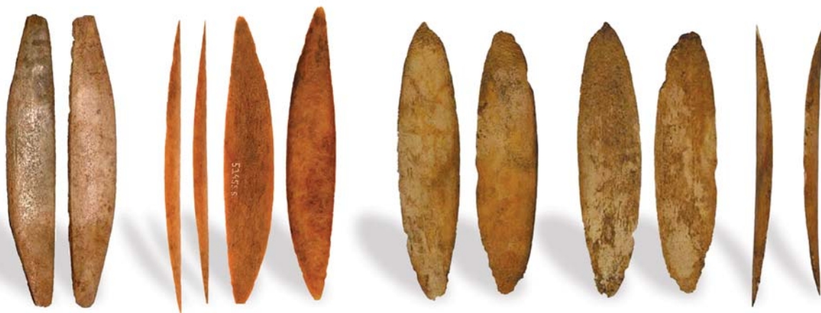
11. ábra: Békés Povádzug 45.

A markolatlemezek kialakítása során törekedni kell a tipikus formák alkalmazására: „aszimmetrikus-tört” (11. ábra), „aszimmetrikus-ívelt” (12. ábra) és „szimmetrikus” (13. ábra). A leletek alapján, az agancs kéregállományának természetes ívét megtartva a belső szivacsos állományt itt is el kell távolítani (12-13. ábra).