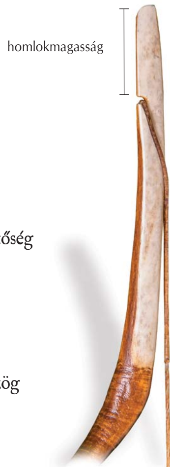
5. ábra: Sárrétudvar-Hízóföld 264-es sír íjrekonstrukciójának szarva

A szarv legyen minél kisebb tömegű de még biztonságos kialakítású, illetve jellemzően trapéz (5. ábra) vagy háromszög (6. ábra) szarvátmetszetű.