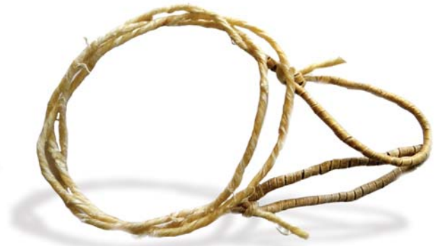
16. ábra: Sodort ínideg kötött bőrfüllel