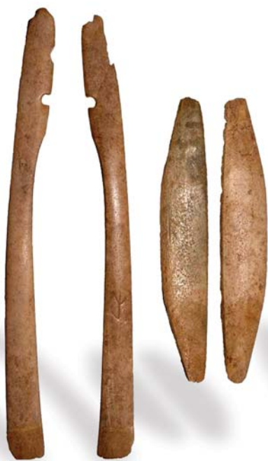
2. ábra: Békés-Povádzug 45. sír íjlemezei