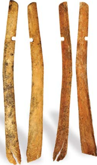
8. ábra: Magyarhomorog 103.